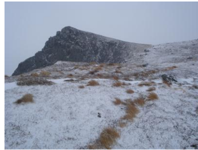
Kloven 505 m.o.h.