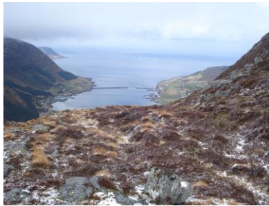
Utsikt på turen.